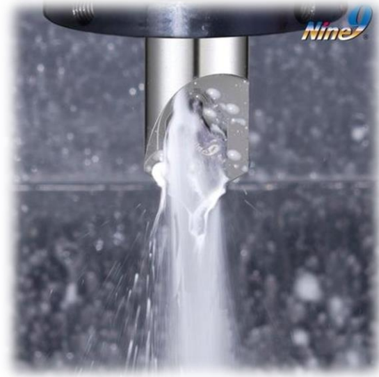
mit interner Kühlmittelzufuhr

Die verschiedenen i-Center Plattengrößen sind auf dem dazugehörigen Halter einsetzbar !